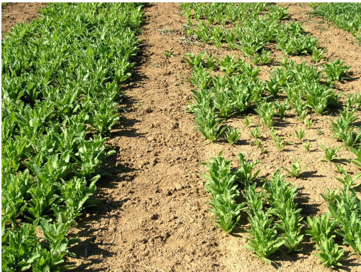
Obrázek 3 - Vliv moření osiva máku na zapojenost porostu, vlevo mák z mořeného osiva na bázi neonicotinoidní účinné látky clothianidin, vpravo nemořená kontrola